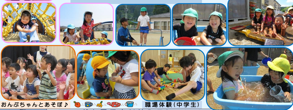
おんぶちゃんとおそぼ♪